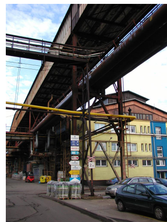
most C-D na území Divize D500, pod ním zavěšené potrubí koksového plynu, zemníhoplynu, parovodu