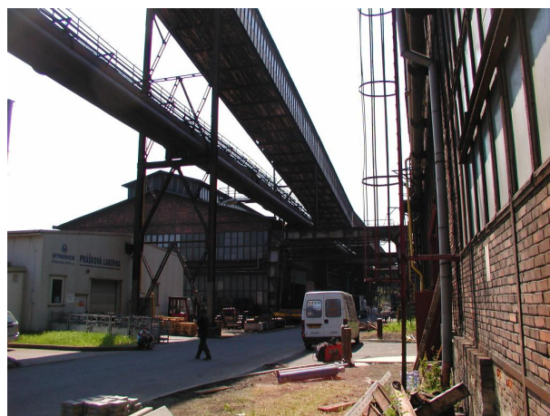
most C-D kolem lahvárny