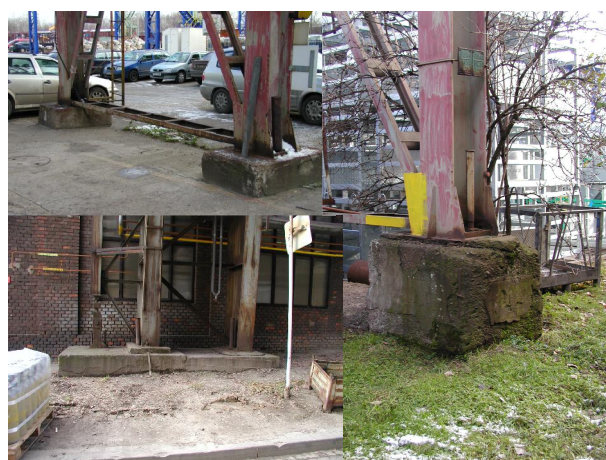
patky podpor mostu