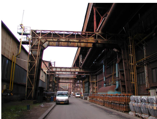
pohled na most C-D na těžkých podporách u lahvárny