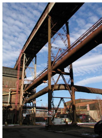
most C-D nad 6.ústřednou