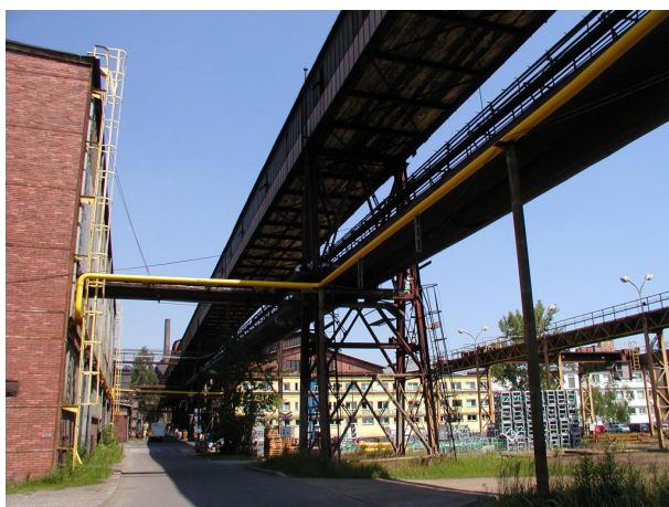
most C-D kolem lahvárny